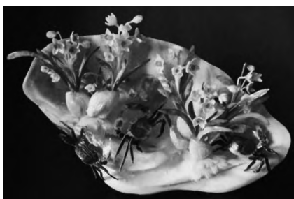
图7 清香惹肥蟹 Fig. 7 Fragrant crab