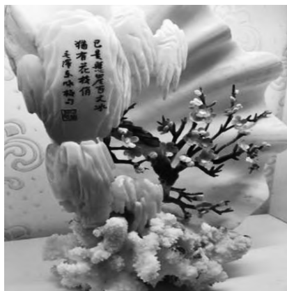
图6 红梅 Fig. 6 Red plum