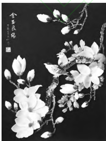
图8 花鸟系聆泉·觅韵 Fig. 8 Flowers and birds · Finding rhyme

贝画是平潭贝雕艺术中独具个性的品种，它采用集浮雕、圆雕和镶嵌于一体的工艺技法。贝画是以贝壳为作画原料，借鉴中国传统书画的手法来写意造境，作品层次鲜明，内容生动且富有风韵，如林暖苏的作品《花鸟系列》，见图8，蒋心忠、詹立新等人的作品《岛礁石厝有人家·秋思》，见图9。