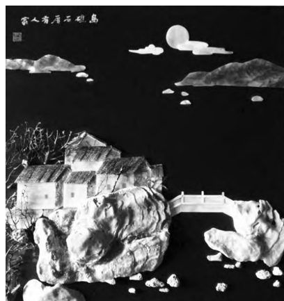
图9 岛礁石厝有人家·秋思 Fig. 9 The family in islands and reefs · Thoughts of autumn

平潭贝雕艺术不论采用何种工艺技法，始终都受到中国绘画的深刻影响。平潭贝雕艺人精湛的手工技艺和独到的专利技术，尤其是在叠加巧饰的运用上，令人叹服。他们以数十年的专注以及精益求精的工匠精神，推动着平潭贝雕艺术的繁荣发展。